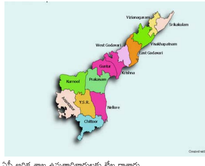
ఏపీ ఆర్థిక శాఖ ఉన్నతాధికారులకు లేఖ రాశారు.

అమరావతి, సెప్టెంబర్ 19, ప్రజాపాలన ప్రతినిధి: ఏపీలో అంతర్జాతీయ ఆర్థిక సంస్థల నిధులతో నడిచే ప్రాజెక్టులకు ఇక ఆర్థిక సాయం బంద్ కానుంది. ఈ ప్రాజెక్టులకి కింద విడుదల చేసిన రూ. 960 కోట్లకు లెక్కలు చెప్పాలని డిపార్ట్ మెంట్ ఎకానమిక్ అఫైర్స్ నుంచి ఆదేశాలు వచ్చాయి. అయితే డిపార్ట్ మెంట్ ఎకానమిక్ అఫైర్స్ రాసిన లేఖపై కేంద్ర ఆర్థిక శాఖ తీవ్రంగా స్పందించింది. గత వారం కేంద్ర ఆర్థిక శాఖ నుంచి ఏపీ ప్రభుత్వానికి ఘాటు లేఖ వచ్చింది. ఈ ప్రాజెక్టుల ద్వారా వస్తున్న నిధులను వేరే పథకాలకు మళ్లించడంపై కేంద్ర ఆర్థిక శాఖ అభ్యంతరం వ్యక్తం చేసింది. రూ. 960కోట్లకు లెక్కలు చెప్పకోవాలనే ధమిష్యత్తో నిధులు విడుదల చేయటానికి అంతర్జాతీయ ఆర్థిక సంస్థలు స్పష్టం చేశాయి. ఈ ప్రాజెక్టులకి కేంద్ర చేపట్టిన పనులకు తమకు బిల్లులు ఇవ్వడం లేదని అంతర్జాతీయ ఆర్థిక సంస్థలకు కాంట్రాక్టర్లు ఫిర్యాదు చేశారు. కాంట్రాక్టర్ ఫిర్యాదుతో అంతర్జాతీయ ఆర్థిక సంస్థలు తీవ్రంగా స్పందించాయి. దీంతో కేంద్ర ప్రభుత్వానికి ఆర్థిక సంస్థలు లేఖ రాశాయి. ఈ పరిస్థితి తీవ్రతను గమనించిన కేంద్ర ఆర్థిక శాఖ తమకు వారం రోజుల్లో వివరణ ఇవ్వాలని