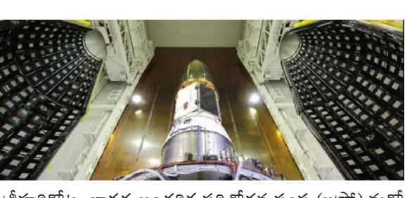
శ్రీహరికోట: భారత అంతరిక్ష పరిశోధన సంస్థ (ఇస్రో) మరో కీలక ప్రయోగానికి ఏర్పాట్లు పూర్తిచేసింది. (మిగతా 2లో..)