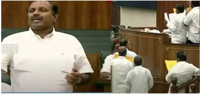
అకస్మాత్తుగా ఈ విషయం బయటకు వచ్చింది. గత రాత్రి ఆన్లైన్లో మంత్రులకు ఈ సవరణలను పంపి, కేబినెట్ అనుమతి కూడా తీసుకున్నట్లు సమాచారం. బుధవారం శాసనసభలో ఈ సవరణ బిల్లు ప్రవేశపెట్టారు..

అమరావతి, ప్రజాపాలన ప్రతినిధి: ఎన్టీఆర్ హెల్త్ యూనివర్సిటీ పేరు మార్పుపై ఏపీ అసెంబ్లీ దదలివంది. జాతీయ స్థాయిలో గుర్తింపు పొందిన డాక్టర్ ఎన్టీఆర్ హెల్త్ యూనివర్సిటీ పేరును మార్చాలని జగన్ సర్కార్ నిర్ణయం తీసుకుంది. ఎన్టీఆర్ పేరు తీసేసి, 'వైఎస్సార్ హెల్త్ యూనివర్సిటీ'గా మార్చాలని తీర్మానించుకుంది. ఇందుకు వీలుగా యూనివర్సిటీ చట్టాన్ని సవరిస్తూ ఆరోగ్యశాఖ ప్రతిపాదనలను సైతం తయారు చేసింది. మంగళవారం రాత్రి