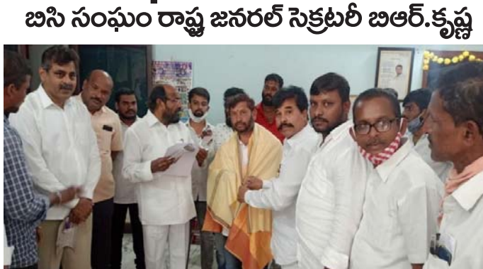
ఆయన మాట్లాడుతూ... బీసీలు అందరూ నమస్వయంతో, నవైక్యంగా, ఏకతాటిపై నడవాలని ఆవశ్యకత ఉందని చెయాలని అన్నారు. ముదిరాజులు, మత్స్యకారులు బిజ్నెస్ గా ఉంటేనే సభ్యులుగా ఎదుగుతారని అన్నారు.