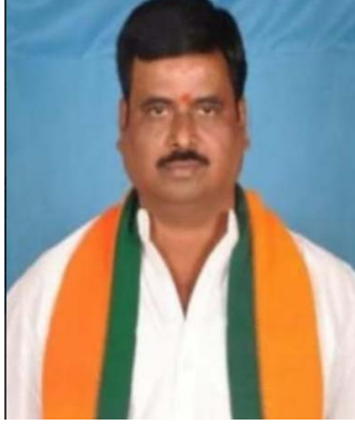
లను నియామించడం జరిగిందన్నారు.