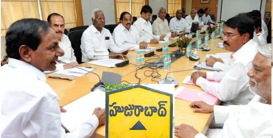
అభిప్రాయపడుతున్నారు. పార్టీని సుదీర్ఘకాలంగా మంత్రి వదలి నుంచి కేసీఆర్ వెంట ఉన్న సమ్మతుకు ఉన్న మరొకరినూ కోసం చూస్తున్నారు. ఉద్యమ కాలం సీనియర్ నేతలు ఈసారి తమకు

కరీంనగర్, సెప్టెంబరు 21, ప్రజాపాలన ప్రతినిధి: హజారాబాద్ ఉప ఎన్నికకు మంత్రి వర్గ విస్తరణకు కేసీఆర్ ముడిపెట్టినట్లు కనిపిస్తుంది. వచ్చే ఎన్నికలకు వెళ్లాలంటే కొత్త లీంత్తో విస్తరించాలని కేసీఆర్ ఆలోచన. ఇందుకోసం మంత్రివర్గాన్ని విస్తరించాలనుకున్నారు. ఈటల రాజేందర్ రాజీనామాతో మంత్రి వర్గంలో ఖాళీ ఏర్పడింది. దీంతో పాటు కొందరు మంత్రులను కేబినెట్ నుంచి తప్పించి కొత్త వారికి అవకాశమివ్వాలని కేసీఆర్ ఎప్పటి నుంచో భావిస్తున్నారు. వరస ఎన్నికలు రావడంతో ఎప్పటికప్పుడు మంత్రి వర్గ విస్తరణను వాయిదా వేస్తూ వస్తున్నారు. మంత్రివర్గంలో చోటు దక్కించుకునేందుకు ఆశావహుల సంఖ్య కూడా ఎక్కువగానే ఉంది. అయితే హజారాబాద్ ఉప ఎన్నికకు ముందు మంత్రి వర్గ విస్తరణ చేపడితే అనమ్మతి, అసంతృప్తి పెరిగే అవకాశముందని కేసీఆర్ ఆలోచిస్తున్నారు. హజారాబాద్ ఉప ఎన్నిక జరిగిన తర్వాత తాను అనుకున్నట్లు విస్తరణ చేపట్టవచ్చని ఆయన అనుకుంటున్నారు. ప్రస్తుతం ఉన్న మంత్రి వర్గంలో కొందరి పనితీరు బాగా లేదని కేసీఆర్