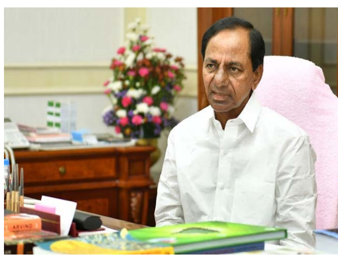
హైదరాబాద్, సెప్టెంబరు 21, ప్రజాపాలన ప్రతినిధి: మద్యం దుకాణాల్లో

రిజర్వేషన్ల అమలు కోసం ప్రభుత్వం ఉత్తర్వులు జారీ చేసింది. మద్యం దుకాణాల్లో గౌడ కులస్థులకు 15 శాతం, ఎస్సీలకు 10 శాతం, ఎస్టీలకు 5 శాతం రిజర్వేషన్ల అమలు చేయాలని ఇటీవల సీఎం కేసీఆర్ అధ్యక్షతన జరిగిన కేబినెట్ భేటీలో నిర్ణయించిన విషయం తెలిసింది. ఈ మేరకు రిజర్వేషన్ల అమలు కోసం మంగళవారం ప్రభుత్వ ప్రధాన కార్యదర్శి సీఎస్ సోమేశ్ కుమార్ ఉత్తర్వులు జారీ చేశారు. రిజర్వేషన్లు 2021-23 నుంచి అమలులోకి రిజర్వేషన్ల అమలులోకి రానున్నాయి. ఇటీవల దళితల అభ్యున్నతి కోసం సీఎం కేసీఆర్ ప్రతిష్టాత్మకంగా దళితబంధు పథకానికి శ్రీకారం చుట్టిన విషయం తెలిసింది. పథకంలో రూ. 10 లక్షల ఆర్థిక సాయం ప్రకటించారు. సాయంతో ఆర్థికంగా నిలదొక్కుకునేందుకు వ్యాపార, ఉపాధి రంగాల్లో రిజర్వేషన్లు కల్పించనున్నట్లు చెప్పారు. అలాగే గతంలో గీత కార్మికులకు సైతం మద్యం దుకాణాల్లో 15 శాతం రిజర్వేషన్లు ఇస్తామని హామీ ఇచ్చారు. ఈ క్రమంలో ఇచ్చిన ఈ హామీ మేరకు రిజర్వేషన్ల అమలు కోసం ప్రభుత్వం ఆదేశాలు జారీ చేసింది.