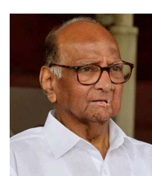
ముంబై, సెప్టెంబరు 21, ప్రజాపాలన ప్రతినిధి: కాంగ్రెస్ పార్టీకి నేషనలిస్ట్ కాంగ్రెస్ పార్టీ అధినేత శరద్ పవార్ వెన్ను పోటు పొడిచారని శివసేన సంచలన వ్యాఖ్యలు చేసింది. పవార్ కాంగ్రెస్ పార్టీ నుంచి వచ్చిన విషయాన్ని గుర్తు చేస్తూ పార్టీ సీనియర్ నేత అనంత్ గిత్ ఈ వ్యాఖ్యలు చేశారు. సోమవారం రాష్ట్రంలో నిర్వహించిన ఓ