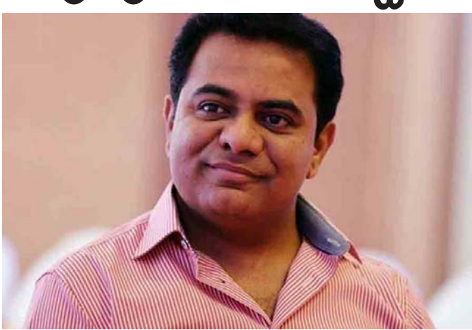
హైదరాబాద్, సెప్టెంబరు 21, ప్రజాపాలన ప్రతినిధి: బాలీవుడ్ డ్రగ్స్ కేసు, ఈడీ కేసులకు సంబంధించి తెలంగాణ ఐటీ, పురపాలక శాఖల

మంత్రి కేటీఆర్ పై ఎలాంటి వ్యాఖ్యలు చేయవద్దని తెలంగాణ కాంగ్రెస్ వర్కింగ్ ప్రెసిడెంట్ రేవంత్ రెడ్డిని సీటీ సివిల్ కోర్టు ఆదేశించింది. ఈ మేరకు రేవంత్ రెడ్డికి నోటీసులు జారీచేసింది. డ్రగ్స్ కేసుకు సంబంధించి రేవంత్ రెడ్డి తరచూ తనపై అసత్యపు ఆరోపణలు చేస్తుండటంతో మంత్రి కేటీఆర్ సీటీ సివిల్ కోర్టులో కోటి రూపాయలకు పరువునష్టం దావావేశారు. ఈ నేపథ్యంలో కోర్టు ఇవాళ ఇంజక్షన్ ఆర్డర్ జారీచేసింది. కాగా, కేటీఆర్ పరువు నష్టం దావాపై అక్టోబర్ 20ని విచారణ జరుపనున్నట్లు సీటీ సివిల్ కోర్టు తెలిపింది. మంత్రి కేటీఆర్ కు డ్రగ్స్ కేసుతో సంబంధం ఉందని, ఆయన డ్రగ్ టెస్ట్ చేయించుకోవాలని వైట్ చాలెంజ్ పేరుతో రేవంత్ రెడ్డి ఇటీవల నవాల్ వినిరారు. ఆ నవాల్ పై స్పందించిన మంత్రి కేటీఆర్.. చర్యపల్లె జైలుకు వెళ్లివచ్చిన వ్యక్తితో కలిసి డ్రగ్ టెస్టుకు వెళ్లి తన స్థాయిని దిగజారుకోలేనని, రాహుల్ గాంధీ డ్రగ్ టెస్టుకు సిద్ధమా..? అని ట్యూటర్లో ప్రశ్నించారు. ఈ క్రమంలోనే మంత్రి కేటీఆర్ రేవంత్ రెడ్డిపై పరువునష్టం దావా కూడా వేశారు.