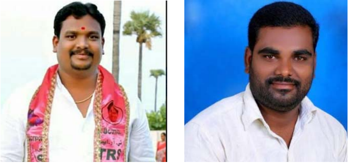
ఇటహింపట్ల మండలం రాయపోల్

అర్ధరాత్రి గ్రామాలు సందర్శించిన జడ్పీ సీఈఓ అప్పారావు