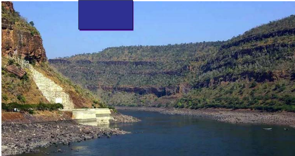
జలాశయాల నీటి నిల్వలు కర్ణాటక దాటిన అనంతరం తగ్గిపోతున్నాయి. కృష్ణా నది తెలంగాణలోని మొదటి ప్రాజెక్టు జూరాల ఉన్నప్పటికీ ఈ ప్రాజెక్టు నీటి సామర్థ్యం తక్కువగా ఉంది.

మనరావుతం అయ్యింది. ఉత్తరతెలంగాణలో పరిస్థితి భిన్నంగా ఉంది. వర్షాభావ వరిస్థితులున్నప్పటికీ కాళేశ్వరం జలాలతో చెరువులు, కుంటలు, శ్రీరాంసాగర్ తదితర జలాశయాలకు నీటి సరఫరా ఉండటంతో ఎక్కడికక్కడ వంటలు వేస్తున్నారు. అయితే కృష్ణా పరివాహక ప్రాంతాల్లో పాలమూరు ప్రాజెక్టు పెండింగ్ లో వడటంతో నీటి నిల్వసామర్థ్యం కరువై జలాశయాల్లో నీరు అడుగంటుతుంది. కృష్ణానది ఉపనదుల పరిస్థితి కూడా ఆశాజనకంగా లేదు. ప్రధానంగా భీమా, దిండి, మూసీ, హాలియా, పాలేరు, మున్నేరు నదుల ప్రవాహం తగ్గడంతో వీటి ఆధారంగా ఉన్న