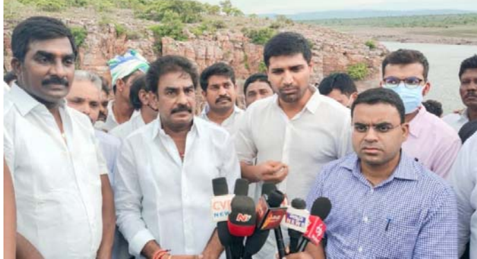
పంపిణీ క్రియారెన్స్ కు 6నెలల కాలం వదుతుందని తెలిపారు. వల్మాడు జలప్రధాయని అయిన ఈ ప్రాజెక్టును పూర్తి చేసి ప్రజలకు నీటి కొరత లేకుండా చూస్తామని స్పష్టం చేశారు.