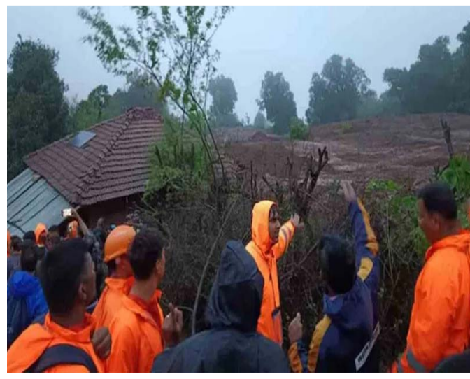
అయ్యే వైద్య ఖర్చులను ప్రభుత్వమే భరిస్తుందని చెప్పారు.

12 మృతదేహాలను వెలికి తీశారు. రెన్నాకు చెందిన ఒక వ్యక్తి గుండెపోటుతో మరణించాడు. సుమారు వందల మంది శిథిలాల కింద చిక్కుకుని ఉంటారని అనుమానిస్తున్నారు. కాగా, ఎన్సీఆర్ఎఫ్ బృందాలను రప్పించి సహాయక చర్యలు చేపట్టారు. శిథిలాల నుంచి 22 మందిని రక్షించారు. సీఎం ఏక్నాథ్ షిండే సంఘటనా స్థలానికి చేరుకున్నారు. రెన్నా చర్యలను పర్యవేక్షించారు. మరణించిన బాధితు కుటుంబాలకు రూ.5 లక్షల చొప్పున ఎక్స్ గ్రేషియా ప్రకటించారు. గాయపడిన వారికి