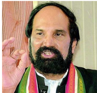
రాష్ట్రంలో అన్ని వర్గాలను టీఆర్ఎస్ మోసం చేసింది: ఉత్తమ్

హైదరాబాద్, ఫిబ్రవరి 14, ప్రజాపాలన : అభివృద్ధిలో దేశానికే ఆదర్శంగా నిలిచి తెలంగాణ రాష్ట్రం ప్రత్యేక గుర్తింపును దక్కించుకుందని రాష్ట్ర పశు సంవర్ధక, మత్స్య, పాడి పరిశ్రమ ల అభివృద్ధి శాఖల మంత్రి తలసాని శ్రీనివాస్ యాదవ్ తెలిపారు. ఆదివారం సనత్ నగర్ నియోజకవర్గంలో ని పలు డివిజన్ లలో టీఆర్ఎస్ పార్టీ సభ్యత్వ సమారూ కార్యక్రమాన్ని ప్రారంభించారు. బన్సిలాల్ పేట డివిజన్ పద్మావతి నగర్, అమీర్ పేట