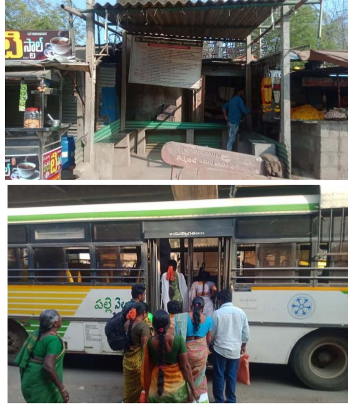
ప్రయాణికులు డిమాండ్ చేస్తున్నారు.

ప్రయాణికులు, వృద్ధులు, వికలాంగులు నానా అవస్థలు పడుతున్నారు. నిత్యం మాగల్లు నుండి మధిరకు బస్సులో ప్రయాణించే ఓ వృద్ధుడు ఆర్టీసీ కాంప్లెక్స్ వద్ద కూర్చోవడానికి స్థలం లేక కాంప్లెక్స్ ఎదురుగా ఉన్న డ్రైనేజీ గోడ మీద కూర్చోని ప్రమాదపాత్ర అందరి గ్రాండ్లోకి వడి మృత్యుచందాడు. ప్రతినిత్యం ప్రయాణికులు సౌకర్యాలు లేమిటో అవస్థలు పడుతున్నారు.