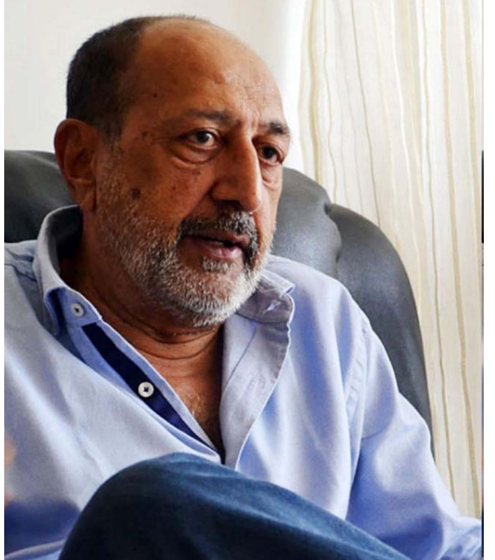
ఆయన సినీమాకు ఒక పాజిటివ్ ఎలిమెంట్ గా ఉంటాడు అంటూ ఇండస్ట్రీ వర్గాల వారు అభిప్రాయం వ్యక్తం చేస్తున్నారు. సలార్ సినీమా మొదటి పార్ట్ సెప్టెంబర్ లో రానుండగా.. రెండవ పార్ట్ వచ్చే ఏడాది లో విడుదల అయ్యే అవకాశాలు ఉన్నాయి.

కేజీఎఫ్ లో అసంత్ నాథ్.. ప్రకాష్ రాజ్ లు కనిపించింది కొన్ని నిమిషాలు అయినా కూడా వారి పాత్రలు ఎంత పవర్ ఫుల్ గా ఉంటాయో అందరికీ తెలిసింది. ప్రస్తుతం కేజీఎఫ్ మేకర్ ప్రకాష్ నీల్ ‘సలార్’ సినీమాను చేస్తున్నాడు. కేజీఎఫ్ మాదిరిగానే సలార్ కూడా రెండు పార్ట్ లుగా రాబోతున్నట్లుగా అధికారికంగా ప్రకటన వచ్చింది. సలార్ 1 థీజర్ తాజాగా ప్రేక్షకుల ముందుకు వచ్చింది. థీజర్ లో సీనియర్ నటుడు తీను ఆనంద్ ఎక్కువ స్క్రీన్ స్పేస్ ను దక్కించుకున్నాడు. అంతే కాకుండా ఆయన డైలాగ్ కూడా థీజర్ స్టాయిని పెంచేసింది అనందంలో సందేహం లేదు. హీరో పాత్రను ఎలివేట్ చేయడం కోసం తీను ఆనంద్ తో చెప్పించిన డైనోసర్ డైలాగ్ అదిరి పోయింది. ఆ డైలాగ్ ఆయన కాకుండా మరివ్వరు చెప్పినా కూడా అంత స్ట్రాంగ్ గా ఉండేది కాదు అంటూ నెటిజన్లు మాట్లాడుకుంటున్నారు. ఇదే సమయంలో తీను ఆనంద్ గురించి సోషల్ మీడియాలో.. ఇంటర్వెట్ లో తెగ వెతికేస్తున్నారు. తీను ఆనంద్ గతంలో తెలుగు లో పలు సినీమాల్లో కనిపించాడు. ముఖ్యంగా బాలయ్య నటించిన ‘అదిత్య 369’ సినీమా తో పాటు చిరంజీవి నటించిన ‘అంజీ’ సినీమాల్లో కీలక పాత్రల్లో నటించాడు. ఆ తర్వాత సాహె.. సీతా రామం సినీమాల్లో కూడా కనిపించాడు. తీను ఆనంద్ కేవలం నటుడు మాత్రమే కాకుండా ఒక మంచి రచయిత ఇంకా దర్శకుడు అంటూ పలు సినీమాలతో నిరూపించుకున్నాడు. దర్శకత్వం మానేసి రెండు పదుల సంవత్సరాలు అవుతుంది. కానీ నటుడిగా మాత్రం ఈ వయసులో కూడా వచ్చిన ప్రతి ఒక్క ఆఫర్ ను సద్వినియోగం చేసుకుంటూ సినీమాలో ప్రత్యేక ఆకర్షణగా నిలుస్తున్నాడు. హిందీ ఇంకా సౌత్ ఇండియన్ భాషల్లో తీను ఆనంద్ ఈమధ్య చేసిన పాత్రలు మంచి పేరును తెచ్చుకున్నాయి. సలార్ సినీమాలో తీను ఆనంద్ పాత్ర ఎంత చిన్నది అయినా కూడా ఆయన ఉండటం అనేది సినీమాకు పాజిటివ్ బజ్ వచ్చేలా చేస్తుంది.. అంతే కాకుండా