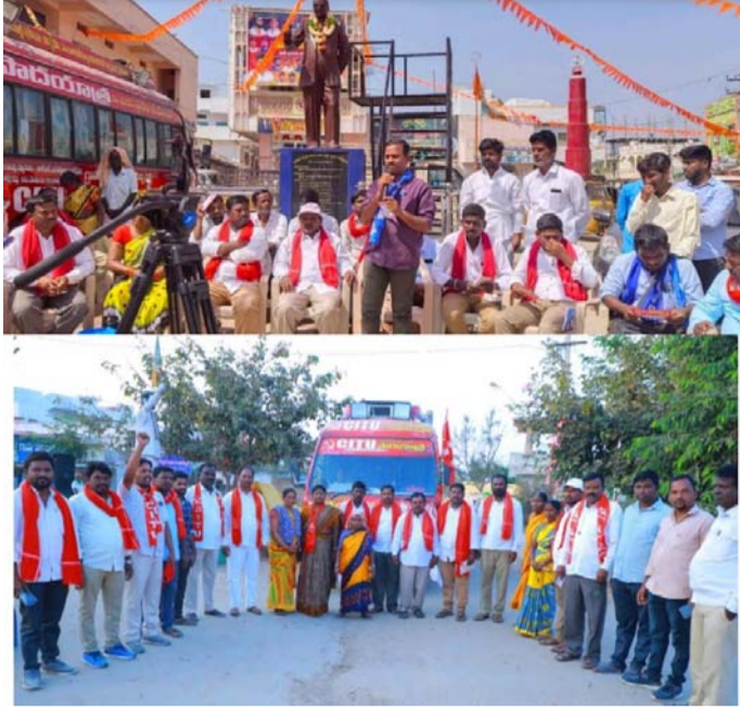
నిర్వహించారు తొలుత అంబేద్కర్ పై రాష్ట్ర ప్రభుత్వం తక్షణమే విగ్రహానికి వూలదండ వేసిన స్పందించి పాదయాత్ర బృందంతో అనంతరం ఆయన ప్రసంగించారు. చర్చలు జరుపాలన్నారు కనీస వేతనం 26వేల రూపాయలు కార్మికులందరికీ డబ్బె డెడ్ రూమ్