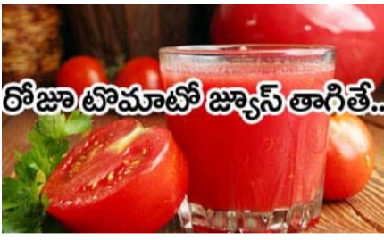
రోజూ టోమాటో జ్యూస్ తాగితే..

రోజూ రెండు గ్లాసుల టోమాటో జ్యూస్ తాగితే ఎముకలు బలం గా తయారవుతాయి. టోమాటో జ్యూస్ తాగితే ఎముకలు బలం గా తయారవుతాయి. టోమాటో జ్యూస్ తాగితే ఎముకలు బలం గా తయారవుతాయి. టోమాటో జ్యూస్ తాగితే ఎముకలు బలం గా తయారవుతాయి.