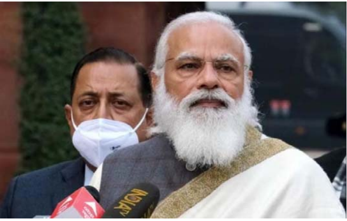
ఫుంట్లైన్ వర్కర్లకు.. కొవిడ్ క్రాఫ్ కోర్సు ఈ నెల 18న