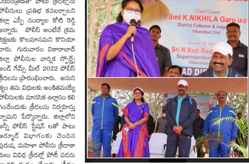
పోలీస్ క్రీడాకారులు మార్చి ఫాస్ట్ నిర్వహించడంతో పాటు, జిల్లా