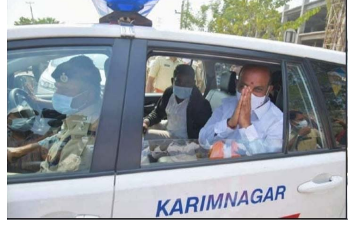
విధించడంతో పాటు బెయిల్ ఆయన్ను కరీంనగర్ జైలుకు పిటీషన్ ను తిరస్కరించింది. దీంతో తరలించనున్నారు. ఉపాధ్యాయ

కరీంనగర్ : తెలంగాణ బీజేపీ అధ్యక్షుడు బండి సంజయ్ కి 14 రోజుల జ్యుడిషియల్ రిమాండ్ విధించింది కరీంనగర్ కోర్ట్. కోవిడ్ నిబంధనలను ఉల్లంఘిస్తూ సభ నిర్వహించడంతో పాటు పోలీసులపై అనుచితంగా ప్రవర్తించడం వంటి కేసుల్లో రిమాండ్ విధిస్తూ తీర్పు ఇచ్చింది. నిన్న అదుపులోకి తీసుకున్న బండి సంజయ్ ని పోలీసులు ఈరోజు కోర్టు ముందు హాజరుపరిచింది. బండి సంజయ్ కి రిమాండ్