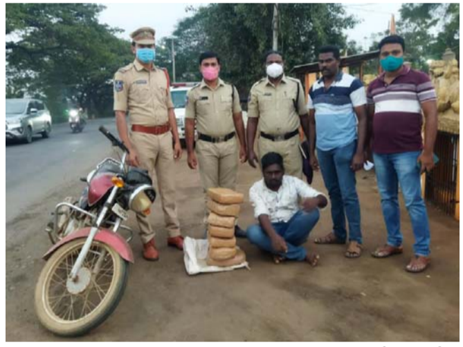
ఖమ్మం జిల్లా వైరా మండలం గండగలపాడు సమీపంలో పోలీసులు వాహనాల తనిఖీల్లో బైక్ పై గంజాయి తరలిస్తున్న వ్యక్తిని వట్టుకున్నా పోలీసులు. నిందితుని వద్ద నుంచి లక్ష రూపాయల విలువైన గంజాయి ప్యాకెట్లు బైక్ స్వాధీనం.