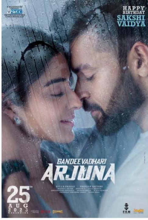
మెగా ఫ్యామిలీ నుంచి హీరోగా ఎంట్రి ఇచ్చిన వరుణ్

బకాన్ స్టార్ అల్లు అర్జున్ - క్రియేటివ్ డైరెక్టర్ సుకుమార్ కలయికలో అత్యంత ప్రతిష్టాత్మకంగా వచ్చిన 'పుష్ప - ది రైజ్' చిత్రం సూపర్ హిట్ అయిన సంగతి తెలిసింది. అయితే, తాజాగా 'పుష్ప 2' పై ఓ క్రేజీ ఆప్ డేట్ వినిపిస్తోంది. పుష్ప 2 లో యూనిక్ క్యారెక్టరైజేషన్ ఉన్న హీరోగా బన్నీ రోల్ చాలా వందల వుల్ గా ఉంటుందట. ముఖ్యంగా స్వర్ణముఖి నది పై బన్నీ - విలన్ల మధ్య ఛేజింగ్ సీన్స్ సినిమాలోనే మెయిన్ హైలైట్ గా నిలుస్తాయట. ఈ సీన్స్ ఇంటర్వెల్ లో వస్తాయని తెలుస్తోంది. బన్నీ పాత్రను పరిచయం చేస్తూ వచ్చే ఈ ఇంటర్వెల్ సీన్స్ గొప్ప డ్రిల్లింగ్ ఎలిమెంట్ గా నిలుస్తాయని.. పైగా ఎవ్వరూ ఊహించని విధంగా ఉంటాయని తెలుస్తోంది. ఇక ఈ పుష్ప సీక్వెల్ లో కొన్ని కీలక పాత్రలతో పాటు పలు కొత్త పాత్రలు కూడా ఈ పుష్ప 2లో పరిచయం కానున్నాయి. ప్రముఖ నటీనటులు ఈ సీక్వెల్ లో కనిపించనున్నారు. అందుకే పుష్ప 2 కోసం ఫ్యాన్స్ రెజ్టింపు ఆసక్తితో ఎదురు చూస్తున్నారు. మైత్రీ మూవీ మేకర్స్ ఈ చిత్రాన్ని భారీ ఎత్తున నిర్మించింది. ఈ చిత్రానికి దేవి శ్రీ ప్రసాద్ సంగీతం అందించనున్నారు.