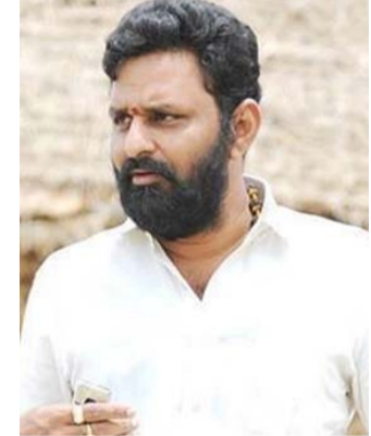
పవన్ బెదిరింపులకు జగన్ ప్రభుత్వం