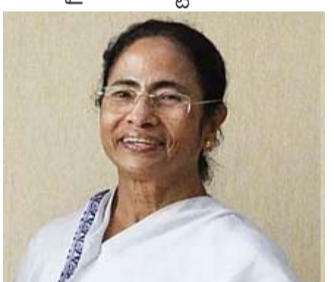
మమత బెనర్జీ ఘన విజయం

భిన్నాభిప్రాయాలు వ్యక్తం చేయడంతో.. సుదీర్ఘంగా చర్చించారు. తుదకు బద్వేల్ బరి నుంచి తప్పుకోవాలని టీడీపీ నిర్ణయించింది. చనిపోయిన ప్రజా ప్రతినిధి కుటుంబం నుంచి అభ్యర్థి పోటీలో ఉంటే.. సాంప్రదాయం ప్రకారం పోటీ చేయకూడదని పొలిట్ బ్యూరో సమావేశంలో టీడీపీ నేతలు నిర్ణయించారు. పొలిట్ బ్యూరో సమావేశంలో సై అంటోంది. (మిగతా 2లో..)