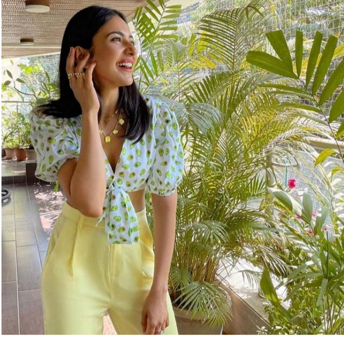
రెగ్యులర్ గా ఫోటోలు వీడియోలతో అభిమానులతో టచ్ లో ఉంటోంది.

రకుల్ ప్రీత్ సింగ్ కెరీర్ ఖతం అయ్యిందని అనుకున్న ప్రతి సారి ఆఫర్లు దక్కించుకుంటూ టాప్ స్టార్ గానే కొనసాగుతూ వస్తోంది. బాలీవుడ్ లో కూడా ప్రస్తుతం ఈ అమ్మడి ప్రాజెక్ట్ లు ఉన్నాయి. తెలుగులో ఈ అమ్మడికి వస్తున్న ఆఫర్లు కూడా చాలానే ఉన్నాయి. స్టార్ హీరోలకు జోడిగా కాకుండా మీడియం రేంజ్ సినిమాల్లో ఈమె నటించేందుకు సిద్ధం అవుతోంది. తమిళంలో కూడా ఈమెకు అదపాద దశపై ఆఫర్లు వస్తున్నాయి. ఈ సమయంలోనే ఈ అమ్మడు నెట్లీంబ హాట్ ఫోటోలతో దుమ్ము దులిపేస్తోంది. నెట్లీంబ ఈమె షేర్ చేసే ఫోటోలు మరియు వీడియోలు ఎప్పుడూ కూడా వైరల్ అవుతూనే ఉంటాయి. తాజాగా ఈ అమ్మడు షేర్ చేసిన ఈ ఫోటోలు ప్రస్తుతం నెట్లీంబ వైరల్ అవుతున్నాయి. ఎల్లో ఎల్లో డబ్బీ ఫెల్లో అంటారు. కానీ రకుల్ ను ఈ కాన్స్ట్రమ్ లో చూస్తుంటే మాత్రం ఆ మాట నిజం కాదు అని విస్తుంది. ఎల్లో లో రకుల్ ఎంత అందంగా ఉందో అంటూ కొందరు కామెంట్స్ చేస్తున్నారు. డైన్ బ్యూటీ ఎక్స్ పోజ్ చేయకున్నా క్లీ వేజ్ షో లేకున్నా కూడా రకుల్ ఫిజిక్ తోనే వాచ్ అనిపించగల సత్తా ఉన్న హీరోయిన్ అంటున్నారు. ప్రస్తుతం షూటింగ్ లు లేకున్నా కూడా రకుల్ ప్రీత్ సింగ్