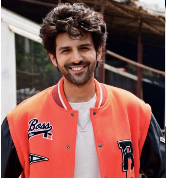
తారసపడతే మళ్లీ ప్రేమ ప్రయాణం షరా మామూలే. మరి 32 ఏళ్ల హీరో పెళ్లి వార్త ఎప్పుడు చెబుతాడో? అలా కాకుండా సల్మాన్ ఖాన్ లా బాలీవుడ్ లో మోస్ట్ ఎలిజిబుల్ బ్యాచిలర్ లా సాగిపోతాడా? చూడాలి.