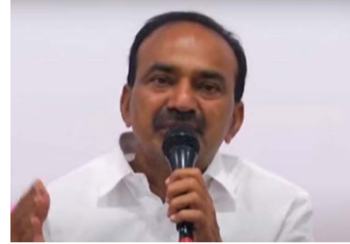
నాచారం ఈవెన్ ఆస్పత్రిలో 350, నిమ్మలో అదనంగా మరో 200 ఆక్సిజన్ బెడ్లు అందుబాటులోకి వచ్చినట్లు తెలిపారు. అదేవిధంగా వారంలో మరో 3,500 ఆక్సిజన్ బెడ్లు అందుబాటులోకి రానున్నట్లు వెల్లడించారు. కరోనా కేసుల పెరుగుదల అంతగా లేదు.. రాష్ట్రంలో కరోనా కేసుల పెరుగుదల అంతగా లేదని, మహారాష్ట్రలోనూ కరోనా కేసులు తగ్గుముఖం పడుతున్నట్లు మంత్రి తెలిపారు. రోగులు పెరిగినా ఇబ్బంది రాకుండా చర్యలు తీసుకుంటున్నట్లు చెప్పారు. ఆస్పత్రుల్లో సిబ్బంది కొరత లేకుండా నియామకాలు చేపడుతున్నట్లు వెల్లడించారు. హెంబ్రో ఐసోలేషన్లో ఉన్న వారిని (మిగతా 2లో...)

హైదరాబాద్, ఏప్రిల్ 27, ప్రజాపాలన ప్రతినిధి: తెలంగాణలో ఆక్సిజన్ కొరత లేదని రాష్ట్ర వైద్యారోగ్యశాఖ మంత్రి ఈటల రాజేందర్ అన్నారు. మీడియాతో మంత్రి మాట్లాడుతూ.. ఆర్మీ సాయంతో ఆక్సిజన్ రవాణా చేసుకున్నట్లు తెలిపారు. అన్ని జిల్లాలకు ఆక్సిజన్ను రవాణా చేస్తున్నట్లు చెప్పారు. రాష్ట్రానికి రోజుకు 270 టన్నుల ఆక్సిజన్ అవసరం కాగా రోజుకు 400 టన్నుల ఆక్సిజన్ వచ్చేలా ఏర్పాట్లు చేసిస్తున్నట్లు వెల్లడించారు. అదేవిధంగా 5.76 లక్షల లీటర్ల ఆక్సిజన్ను ఉత్పత్తి చేస్తున్నామన్నారు. ఆక్సిజన్ పర్యవేక్షణకు ఐఎస్ అధికారులను నియమించినట్లు వివరించారు. 10 వేల బెడ్లకు ఆక్సిజన్ సదుపాయం కల్పించినట్లు చెప్పారు. గాంధీలో అదనంగా మరో 400 ఆక్సిజన్ బెడ్లు, టిమ్మలో అదనంగా 300,