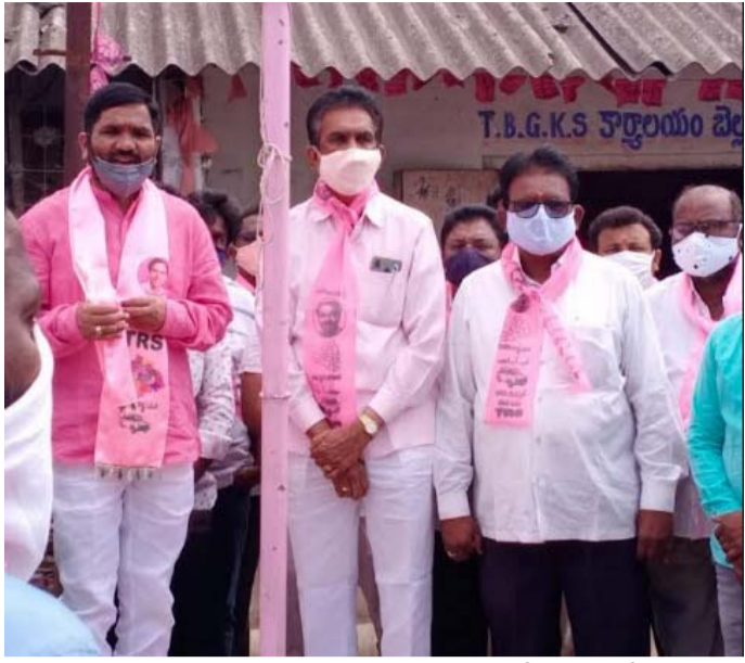
బెల్లంపల్లి మార్చి 27 ప్రజా పాలన ప్రతినిధి:తెలంగాణ రాష్ట్ర సమితి 20 ఆవిర్భావ దినోత్సవ వేడుకలను పాటిస్తూ