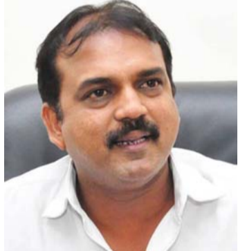
బన్నీతోనే సినిమా చేస్తాడట. ఆ తర్వాత బాలయ్య బాబుతో కూడా ఓ సినిమా చేస్తాడని వార్తలు వస్తున్నాయి. మరి హీరోల ఇమేజ్ ను బట్టి కథలు రాసే కొరటాల, బన్నీ ధనుష్ కోసం ఎలాంటి కథ రాశాడో చూడాలి.