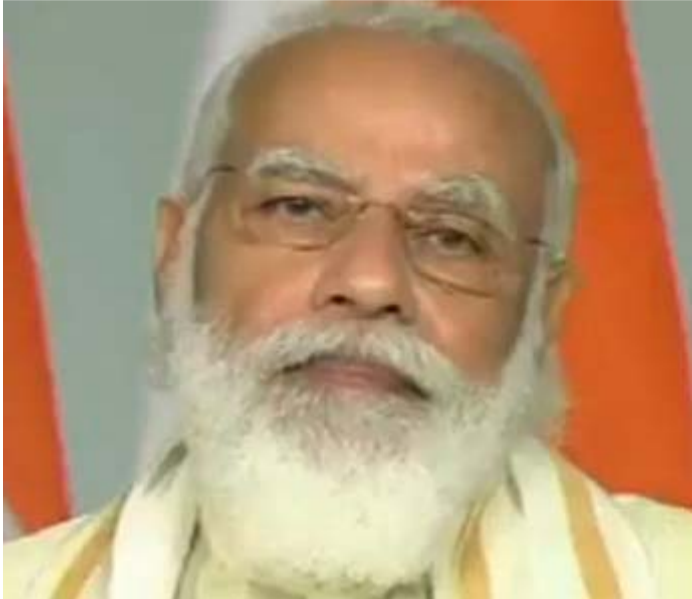
అమెరికా తెలుగు అమ్మాయికి ఉపరాష్ట్రపతి ప్రశంసలు

న్యూఢిల్లీ, అక్టోబర్ 19, ప్రజాపాలన : ఈ దశాబ్దం 'భారత్ దశాబ్దం' గా మార్చడానికే అన్ని రంగాల్లో అత్యవసరం సంస్కరణలను చేపట్టామని ప్రధాన మంత్రి నరేంద్ర మోదీ ప్రకటించారు. గత 6,7 నెలలుగా అన్ని రంగాల్లో త్వరిత గతిన సంస్కరణలను చేపట్టిన విషయాన్ని ప్రజలు గమనించే ఉంటారని ఆయన తెలిపారు. మైసూరు విశ్వవిద్యాలయం శతాబ్ది సమావేశాలను పురస్కరించుకొని ప్రధాని మోదీ వీడియో కాన్ఫరెన్స్ ద్వారా ప్రసంగించారు. వ్యవసాయం, ఆంతుర్కం, రక్షణ, విమానయానం, కార్మికం... ఇలా ప్రతి రంగంలోనూ వేగంగా సంస్కరణలు చేపట్టామని, ఇవన్నీ దేశంలోని యువతను దృష్టిలో పెట్టుకునే చేస్తున్నామని ఆయన తెలిపారు. "ఈ దశాబ్దం మన భారత్ దే కావాలి. పునాదులను పటిష్ఠం చేసినప్పుడే అది సాధ్యమవుతుంది. ఈ దశాబ్దం దేశంలోని యువతకు అపారమైన అవకాశాన్ని తెచ్చిపెట్టింది." అని ప్రధాని ప్రకటించారు. దేశంలో ఇంతకు మునుపు ఎన్నడూ ఇలాంటి సంస్కరణలు జరగలేదని, ఓ నిర్ణయం తీసుకుంటే ఒక రంగానికి మాత్రమే ప్రయోజనం జరిగేదని, ఇతరులు వెనకబడిపోయేవారని అన్నారు. ఇప్పుడు మాత్రం అన్ని రంగాల్లో సంస్కరణలు చేపట్టామని ఆయన తెలిపారు. సూతనంగా రూపొందించిన విద్యా విధానం దేశంలో సమూల మార్పులు తెస్తుందని ఆయన ఆశాభావం వ్యక్తం చేశారు. విద్యార్థుల్లో సామర్థ్యాన్ని, పోటీ తత్వాన్ని పెంచే విషయంతో పాటు బహుముఖీన రంగాల్లో దృష్టి సారించే అవకాశం ఈ విద్యా విధానంతో సాధ్యమవుతుందన్నారు. కేవలం కొత్త సంస్థలను ప్రారంభించడానికే ఉన్నత విద్యలో కొత్త సంస్కరణలు తేవడం లేదని, పాలన పరంగా, జెండర్ పరంగా, సామాజికంగా కూడా మార్పులు తేవడానికి అని మోదీ తెలిపారు.