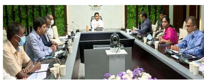
సెకండరీ ఎడ్యుకేషన్తోపాటు.. గ్రామీణులకు ఉపయోగకరంగా డిజిటల్ లైబ్రరీలు ఉండాలని అధికారులకు సూచించారు. డిజిటల్ లైబ్రరీలో కామన్ ఎంట్రన్స్ టెక్నాలజీతోపాటు.. ఆన్లైన్ రకాల పోటీల పరీక్షలకు అందుబాటులో స్టడీ మెటీరియల్ ఉండాలని అధికారులను ఆదేశించారు. గ్రామ సచివాలయాలు, ఆర్ బీ కేలకూ ఇంటర్నెట్ సదుపాయం అందించాలని, నిరంతరం ఇంటర్నెట్ కలిపించే దిశగా చర్యలు తీసుకోవాలని సీఎం అధికారులకు సూచించారు. ప్రతి గ్రామ పంచాయతీలోనూ డిజిటల్ లైబ్రరీ ఏర్పాటు చేయాలని, తొలి విడతలో

అమరావతి, ఆగస్టు 3 ప్రజాపాలన ప్రతినిధి: వర్క్ ఫ్రం హోం కాన్సెప్ట్ను బలోపేతం చేసే దిశగా చర్యలు తీసుకోవాలని ముఖ్యమంత్రి వైఎస్ జగన్మోహన్ రెడ్డి అధికారులను ఆదేశించారు. ఐటీ శాఖ, డిజిటల్ లైబ్రరీ పై సీఎం వైఎస్ జగన్ మంగళవారం తాడేపల్లిలోని తన క్యాంప్ కార్యాలయంలో సమీక్ష నిర్వహించారు. ఈ సందర్భంగా సీఎం జగన్ మాట్లాడుతూ.. గ్రామాలకు మంచి సామర్థ్యం గల ఇంటర్నెట్ కోసం ప్రభుత్వం చర్యలు తీసుకుంటోందని చెప్పారు. ప్రైవేటీ, సెకండరీ ఎడ్యుకేషన్తోపాటు.. గ్రామీణులకు ఉపయోగకరంగా డిజిటల్ లైబ్రరీలు ఉండాలని అధికారులకు సూచించారు. డిజిటల్ లైబ్రరీలో కామన్ ఎంట్రన్స్ టెక్నాలజీతోపాటు.. ఆన్లైన్ రకాల పోటీల పరీక్షలకు అందుబాటులో స్టడీ మెటీరియల్ ఉండాలని అధికారులను ఆదేశించారు. గ్రామ సచివాలయాలు, ఆర్ బీ కేలకూ ఇంటర్నెట్ సదుపాయం అందించాలని, నిరంతరం ఇంటర్నెట్ కలిపించే దిశగా చర్యలు తీసుకోవాలని సీఎం అధికారులకు సూచించారు. ప్రతి గ్రామ పంచాయతీలోనూ డిజిటల్ లైబ్రరీ ఏర్పాటు చేయాలని, తొలి విడతలో