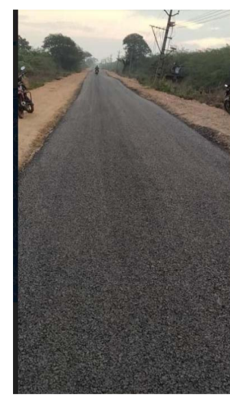
దెవలవ్ వెంట బ్యాంక్ సహకారంతో రాష్ట్రంలో రోడ్ల కనెక్టివిటీ పెంచుతున్నామన్నారు. మండలాల నుండి జిల్లా హెడ్ క్వార్టర్స్ కు వెళ్ళే రోడ్లను అభివృద్ధి చేస్తున్నామని మంత్రి కొడాలి నాని తెలిపారు.

పంట, మురుగు కాలువలు ఉన్న ప్రాంతాల్లో కొత్తగా నిర్మించే రోడ్లు పాడవకుండా రిటైనింగ్ వాల్స్ నిర్మాణానికి అత్యధిక ప్రాధాన్యం ఇస్తున్నామన్నారు. కాగా మున్సిపాలిటీలు, నగరాల్లో రోడ్ల మరమ్మత్తులకు అవసరమైన చర్యలు తీసుకోవాలని సీఎం జగన్మోహన్ రెడ్డి చేపడుతున్నామన్నారు. రోడ్లు, అభివృద్ధికి ప్రభుత్వం నుండి మరన్ని నిధులు మంజూరుయ్యేలా కృషి చేస్తున్నట్లు చెప్పారు. అలాగే గుడివాడ పట్టణంలో పెడకాల్వ నిర్మాణాలపై మంత్రి కొడాలి నాని సెంటర్ నుండి మండలపాడు రైల్వేగేటు వరకు, గుడివాడ - కంకిపాడు ప్రధాన రహదారిని మండల కేంద్రమైన పెడపాడుపూడి వరకు నిర్మిస్తున్నామన్నారు. రోడ్లను నాణ్యతా ప్రమాణాలకునుగుణంగా నిర్మించడం జరుగుతుందన్నారు. రోడ్లకు ఇరువైపులా పెద్ద పెద్ద