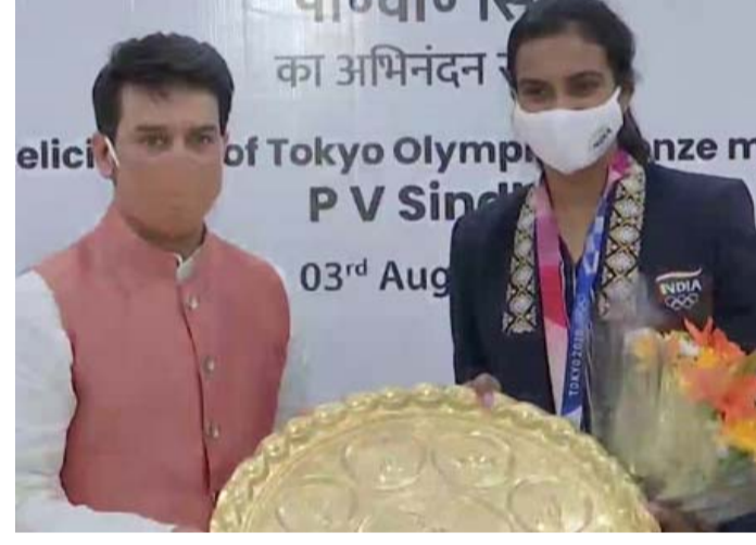
వైఫల్యంపై నిరాశ చెందినప్పటికీ ఒలింపిక్స్ లో వరుసగా రెండోసారి పతకం సాధించడం ఎంతో సంతోషం కలిగించింది సింధు అన్నారు. తన కోసం ఎన్నో త్యాగాలు చేయడంతోపాటు నిరంతరం మద్దతునిచ్చిన తల్లిదండ్రులకు, తన కల నిజమయ్యేలా సదా తోడ్పాటునిచ్చిన కోచ్ కి కృతజ్ఞతలు తెలుపుతున్నానని సింధు చెప్పారు. కార్యక్రమంలో సింధు తల్లిదండ్రులు కూడా పాల్గొన్నారు.