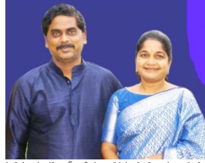
ఎంపిక అయ్యారని, అల్ ఇండియా సైనిక్ పాఠశాలకు 7 మంది 6వ తరగతి లో , ఒక్కరు 9వ తరగతి కి ఎంపిక అయ్యారని తెలిపారు. అదేవిధంగా ఏకలవ్య మోడల్ స్కూల్ (రుక్మిణి ) కు 9మంది ఎంపిక అయ్యారని ఆమె తెలిపారు. తమ సెంటర్ నుంచి దాదాపు 30మంది విద్యార్థులు ఎంపిక కావడం ఆనందంగా ఉందని పేర్కొన్నారు. ఈ సంవత్సరం అడ్మిషన్లు ప్రారంభం అయ్యాయని ఈ అవకాశాన్ని పేద , నిరుపేద కుటుంబానికి చెందిన వారు వినియో గించుకోవాలని పేర్కొన్నారు.

విద్యార్థులకు ఈ నరన్యతి నిలయాలు వరంగా మారాయని , ఎంపికైన విద్యార్థులకు కార్పొరేట్ కు దీటుగా విద్యను అందిస్తున్నాయని తెలిపారు. ఐతే గ్రామీణ ప్రాంతాల్లో అవగాహన లేక , తల్లిదండ్రులు విద్యార్థులకు సరైన శిక్షణ ఇవ్వకుండా ప్రవేశ పరీక్ష రాయించడం తో ఫలితాలు రావడం లేదని అన్నారు. తమ ఇనిస్టిట్యూట్ ద్వారా పేద విద్యార్థులకు అతితక్కువ ఫీజుతో శిక్షణ ఇవ్వడం జరిగిందని తెలిపారు. ఈ విద్యా సంవత్సరం లో నవోదయ కు 11 మంది 6వ తరగతి లో ఇద్దరు 9వ తరగతి కి