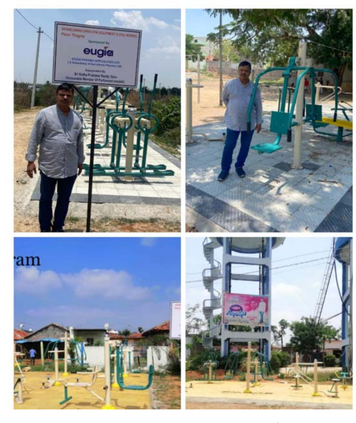
గడపదం కోసం ఓపెన్ జిమ్ లోని అధునాతన సాంకేతిక పరికరాలు