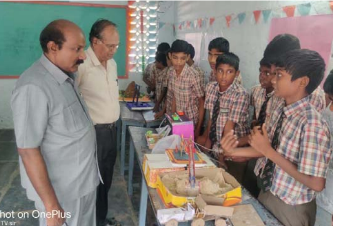
పాఠ్యాయు సిబ్బంది, ఉపాధ్యాయేతర ప్రముఖులు, విద్యార్థి నీ, సిబ్బంది, సైన్స్ ఎగ్జిబిషన్ ను విద్యార్థులు, వారి తల్లిదండ్రులు తిలకించేందుకు ఆయా రంగాల పెద్ద సంఖ్యలో హాజరయ్యారు.