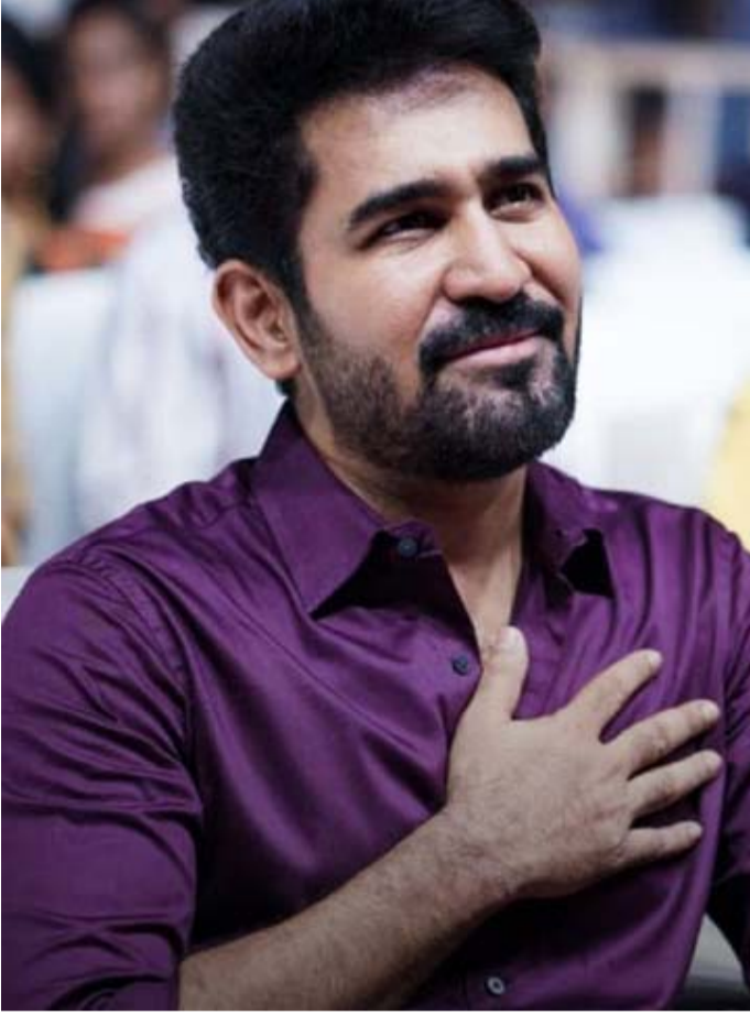
త్వరగా పూర్తి చేసుకుని 2025లో రిలీజ్ చేస్తారనే టాక్ వినిపిస్తోంది.

తన ట్యూన్ మార్కెట్ లోకి తీసుకొస్తున్నారు. త్వరలో సినిమా రిలీజ్ నేపథ్యంలో ఆర్ పి పలు విషయాలు పంచుకున్నారు. ఆ వేంకో ఆయన మాటల్లోనే.. సంగీతం చేయమని చాలా మంది అవకాశాలిచ్చారు. కానీ చేయాలనిపించలేదు. ఏదైనా కథ నచ్చితేనే చేస్తాను. లేకపోతే చేయాలనిపించదు. కానీ నా చేతిలో సినిమా ఉన్నా.. లేకపోయినా రోజు 18 గంటలు పని చేయడం అలవాటు. ప్రస్తుతం కన్నడలో కొన్ని సినిమాలు చేస్తున్నా. దర్శకుడి కథలు సిద్ధం చేస్తున్నా. నేను ఎన్ని చేసినా సంగీతమే ఎక్కువ పేరు తీసుకొచ్చింది. అంతా నన్ను సంగీత దర్శకుడిగానే చూస్తారు. ఓ సందర్భంలో మళ్లీ సంగీతం చేయమని చెప్పి మానేసారు. కానీ ఓ సందర్భంలో బాలుగారు మళ్లీ సంగీతం ఎప్పుడు మొదలు పెడుతున్నావ్ అని అడిగారు. ఆయనకు చేస్తాను గురువు గారు అని చెప్పేవాడిని. ఆయన వెళ్లిపోయాక ఆయనకు ఇచ్చిన మాటను నిలబెట్టుకోలేకపోయాను అనిపించింది. బాలు పాటపై ఉన్న అభిమానంతో సినిమాల్లోకి వచ్చా. ఈ నేపథ్యంలో తేజ గారిని కలిసాక మళ్లీ సంగీతం చేయాలి. అది బాలు గారి కోరిక అని చెప్పా. ఆ తర్వాత కొన్నాళ్లకి తేజ ఫోన్ చేసి 'చిత్రం-2' చేస్తున్నామని చెప్పారు. ఆ ప్రాజెక్ట్ స్థానంలోనే 'అహింస' వచ్చింది. కథకు తగ్గట్టు మంచి పాటలు కుదిరాయి. అహింస సిద్ధాంతాన్ని నమ్మే ఓ అబ్బాయి కథ ఇది' అని అన్నారు.