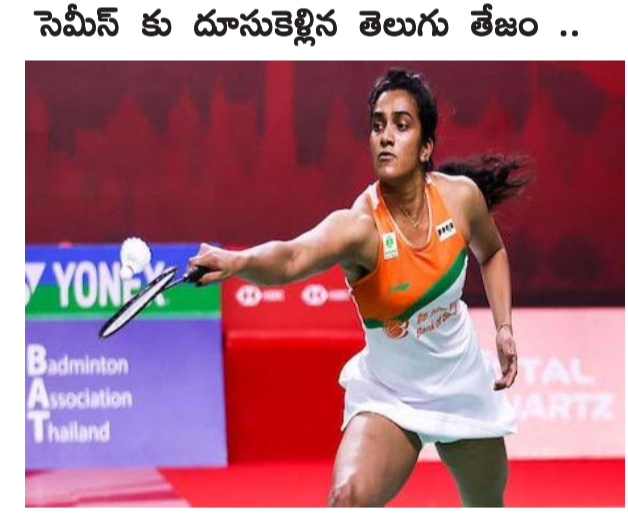
సెమీస్ కు దూసుకెళ్లిన తెలుగు తేజం ..

టోక్యో, జూలై 30, ప్రజాపాలన ప్రతినిధి : టోక్యో ఒలింపిక్స్ లో పీవీ సింధు దూకుడు కొనసాగుతోంది. టోక్యో ఒలింపిక్స్ లో స్వర్ణ పతకమే టార్గెట్ గా బరిలోకి దిగిన పీవీ సింధు మరో ఘన విజయాన్ని నమోదు చేసింది. క్వార్టర్ ఫైనల్ లో ఐదో ర్యాంకర్ జపాన్ క్రీడాకారిణి అకానె యమగుచిపై వరుస సెట్లలో గెలుపొందింది. 21-13, 22-20 తేడాతో విజయతేజవం ఎగురవేసింది. మొదటి సెట్ లో అలవోకగా నెగ్గిన సింధు.. రెండో సెట్ లో ప్రత్యర్థి సుచి సవాలే ఎదురైంది. ఇద్దరూ షేయర్లు ప్రతి పాయింట్ కోసం హోరాహోరీగా పోటీపడ్డారు. సుదీర్ఘమైన ర్యాలీలు ఆడారు. రెండో సెట్ లో గేమ్ పాయింట్ కావకుని మ్యాచ్ గెలిచింది పీవీ సింధు. 56 నిమిషాల పాటు జరిగిన మ్యాచ్ లో సింధు నెగ్గింది. గతంలో వీరద్దూరు 18 సార్లు పోటీపడగా 11-7తో సింధుదే పైచేయి.