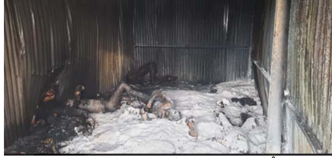
సరియైన సదుపాయాలు వారి జీతాలు సక్రమంగా అందేవిధంగా చూడాలని అన్నారు. ఇటువంటి ఘట్టనలు పునరావృతం కాకుండా చూడాలని డిమాండ్ చేశారు. ఈ ఘటనపై ప్రభుత్వ శాఖలో పలు అధికారులు కార్యక శాఖ, మత్స శాఖ, తహసీల్దార్ సంబంధిత అధికారులుతో ఎక్సగ్రేషియా గురించి చర్చించినప్పటికీ ఇంకా

50 లక్షలు ఎక్కు గ్రేషియా ఇవ్వాలి, స్థానిక జిల్లా కలెక్టర్ ప్రమాదం జరిగిన ఆక్కాసాగు యాజమానితో చర్చించి నష్టం పరిహారం ఇప్పించాలి. రాష్ట్ర ప్రభుత్వం కూడా ఎక్స్ గ్రేషియా ప్రకటన విడుదల చేయాలని అన్నారు. ఈ వలస కార్మికులు వివరాలు సంబంధిత కార్యకర్తల ద్వారా మత్సశాఖ అధికారులు వద్ద కూడా లేకపోవడం అంటే కార్మికులు పట్టణాల్లో చేరువై వారి భద్రత ఎవరు చూడాలని అన్నారు. ఇప్పటికయినా రేవల్ల నియోజకవర్గ పరిధిలో చెరువుల సాగు వద్ద ఇతర రాష్ట్రాల వలస కార్మికులు పేర్ల సమయం చేసి వారికి