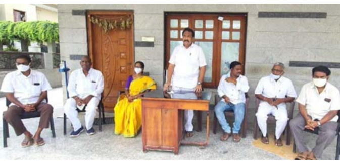
రద్దుచేశారు. ప్రభుత్వం ఏర్పడ్డ రెండేళ్లలో ఒక్క డీ.ఎస్సీ నీ నిర్వహించలేదు. టీడీపీ ప్రభుత్వంలో రెండు డీ.ఎస్సీ లు నిర్వహించి నిరుద్యోగులకు 16 వేల పైగా ఉద్యోగాలు కల్పించారని బండారు అన్నారు. కోవేడ్ సమయంలో ఎంతో మంది ఉపాధ్యాయులు మరణిస్తే ఈ ప్రభుత్వం పట్టించుకోలేదు. లక్షల మంది అలమటి న్నూన్నారు. వారిని ప్రభుత్వం ఆదుకోవాలి, నాడు నేడు విద్యార్థులకు విదేశీ విద్య, ఉన్నత విద్యా పథకాలు నిరుద్యోగ భృతి

నిలిపివేశారు. దీనివలన పలువురు ఎస్సీ, ఎస్టీ, బిసి, ఓసీ పేద విద్యార్థులు నష్టపోయారని అన్నారు. ఉన్నత విద్య కోసం గత నంవత్సరం 2.270 కోట్లు కేటాయిస్తే ఈ సంవత్సరానికి గాను రూ 1.9 70 కోట్లు కేటాయించి రూ 300 కోట్లు ప్రభుత్వం కోత పెట్టింది. రాష్ట్ర భవిష్యత్తుకు మూలాధారమైన విద్యారంగానికి అవసరమైన రీతిలో నిధులు కేటాయించడం లేదు గానీ ప్రచార ఆర్థికాలకు మాత్రం రూ. 5 కోట్లు ఖర్చు చేస్తున్నారని గొప్పలు బారెడు బండారు ఎద్దేవా చేశారు. పేద విద్యార్థులకు విదేశీ విద్య, ఉన్నత విద్యా పథకాలు నిరుద్యోగ భృతి