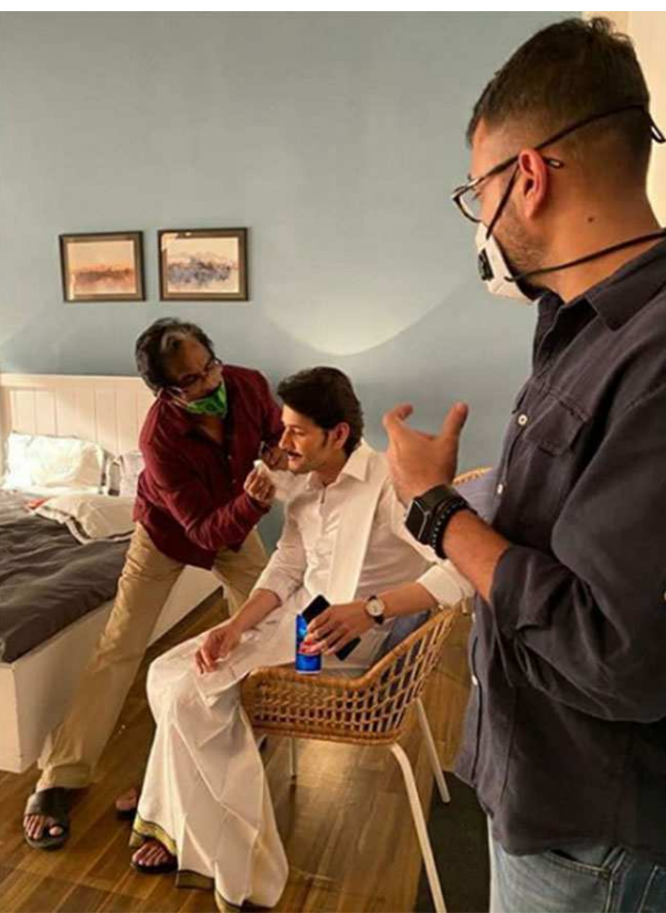
సూపర్ స్టార్ మహేష్ బాబు వయసు పెరుగుతున్న కొద్దీ మరింత అందంగా తయారవుతున్నాడు. ఏజ్ అనేది జస్ట్ నంబర్ మాత్రమే అంటూ నాలుగు పదుల వయస్సు దాటినా ఇంకా ఇరవై ఏళ్ల కుర్రాడిలా హ్యాండ్సుమ్ గా కనిపిస్తున్నాడు. ఆన్ స్క్రీన్ - ఆఫ్

స్క్రీన్ ఒకే విధంగా ఎప్పుడూ క్లీన్ షేప్ తో లైట్ గా మీసాలతో కనిపిస్తుంటాడు మహేష్. ఫస్ట్ సినిమా నుంచి 'సరిలేరు నీకెవ్వరు' వరకు ఇలానే మైంట్ చేస్తూ వచ్చాడు. హాయిలో స్టైల్ లో వేయేషన్ చూపించినప్పటికీ గడ్డం మీసాలలో పెద్దగా చేజ్ చూపించలేదు. కాకపోతే 'భరత్ అనే నేను' 'మహర్షి' సినిమాల్లోని సాంగ్స్ లో పెట్టుకున్న మీసంతో కనిపించి అభిమానులను అలరించాడు. ఇప్పుడు మరోసారి ఓ యాద్ షూట్ కోసం మహేష్ బాబు మీసకట్టుతో దర్శనమిచ్చాడు. ప్రముఖ ఈ-కామర్స్ సైట్ షిప్ కార్డ్ కమర్షియల్ యాద్ కోసం మహేష్ మీసాలతో కనిపించి అభిమానులను ఆశ్చర్యపరిచారు. దీనికి సంబంధించిన ఓ ఫోటోని సోషల్ మీడియా మాధ్యమాల్లో షేర్ చేసింది మహేష్ సతీమణి సప్రత.