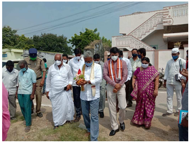
కూరగాయలు మరియు వండ్ల వర్తకం దారులు గ్రామంలోని రోడ్లపై ఎండనకా, వాననకా జీవ నోషాధి కారకు వ్యాపారాలు నిర్వహించుకుంటున్నారని, వైఎస్ఆర్ పార్టీ కార్యకర్తలు, ఇప్పుడా ఇబ్బంది లేకుండా నాయకులు పాల్గొన్నారు.

చంద్రపాడు అక్టోబర్ 28 (ప్రజాపాలన) : గ్రామంలో జాతీయ రురల్ అర్బన్ మిషన్ నిధులు రూ. 20.00 లక్షల అంచనా విలువతో నిర్మించనున్న ప్రూట్స్ మరియు వె జిటీబుల్ మార్కెట్ నిర్మాణానికి శాసనసభ్యులు జగన్మోహన్ రావు అధికారులతో కలిసి శంకుస్థాపన చేశారు. ఈ సందర్భంగా ఎమ్మెల్యే మాట్లాడుతూ గ్రామాల్లో మౌలిక వసతుల కల్పనకు గ్రామాల అభివృద్ధికి ముఖ్యమంత్రి వై.యస్.జగన్మోహన్ రెడ్డి పెద్దపత్తున నిధులు మంజూరు చేస్తున్నారని తెలిపారు. చంద్రపాడు గ్రామంలో సరైన వసతులు కలిగిన మార్కెట్ లేక