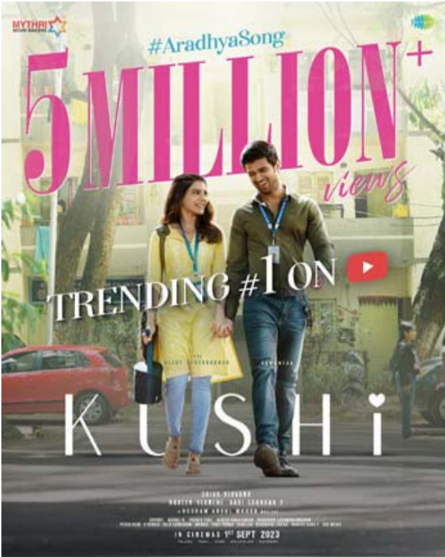
ఈ చిత్రంపై సర్వత్రా ఆసక్తి నెలకొంది.