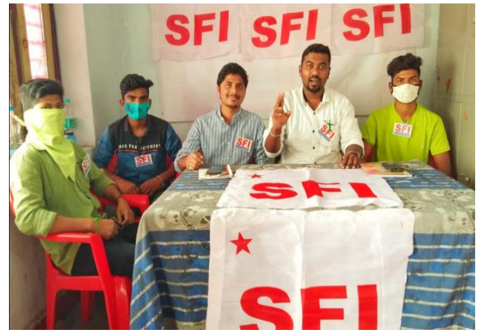
జరిగిందని పేర్కొన్నారు. డిమాండ్ చేశారు. ఈ విద్యార్థులకు నష్టం జరగకుండా ఈనెల 27న ప్రారంభమయ్యే డిగ్రీ పరీక్షలను వాయిదా వేయాలని